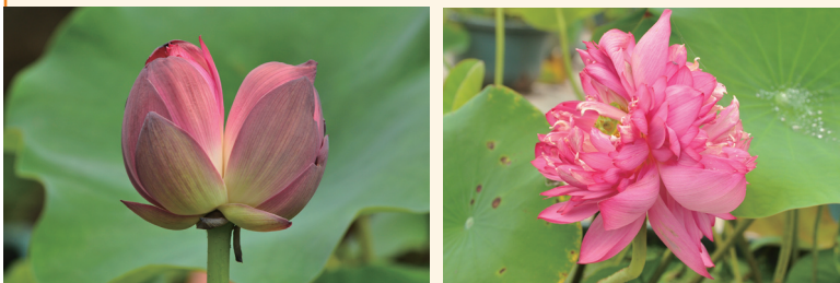
北京莲花池公园的并蒂莲

“青荷盖绿水，芙蓉披红鲜。下有并根藕，上有并蒂莲”这一名句广为流传，但真正见过并蒂莲的人并不多。因为并蒂莲并非是一个品种，而是由突变引起的现象，在诸多品种中出现，其出现概率极低，不稳定，且不能遗传。中国自古以来就喜“成双成对”。一柄双花，自然也是富于吉祥喜庆之意的。并蒂莲是夫妻恩爱、同心同德、互通友好的象征，是善良、美丽的化身。它赋予荷文化更深厚、更特别的内涵，更为每次荷花展增添光彩！