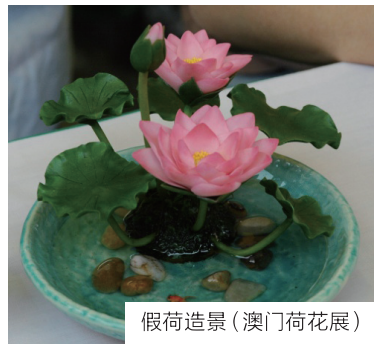
假荷造景(澳门荷花展)

足雅美佳荷花湿地,北京的莲花池、圆明园、颐和园、北海公园、紫竹苑,广东三水荷花世界、番禺莲花山公园、深圳洪湖公园,南昌八一公园,青岛中山公园,山东枣庄的运河湿地公园、沂蒙荷花园,江苏盐城莲苑等。