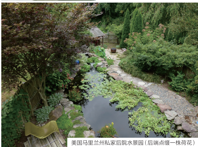
美国马里兰州私家后院水景园(后 endpoint 缀一株荷花)