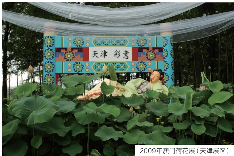
2009年澳门荷花展(天津展区)

期间, 不仅开展荷花新品种、碗莲栽培技术和荷花造景的竞优评选, 还举行荷花分会年会及荷花学术讨论会。目前学术讨论会已发展成国际性会议, 每年都有国际学者及产业界人士参加。2014年7月, 第28届全国荷花展会将分别在江苏金湖县和辽宁铁岭市相继举办。除了全国性荷花展外, 各个省市县, 甚至单位也举行荷花展、荷花节, 如北京每年就有多处夏季同时举办荷花展。据估计, 每年全国就有数十处上百处举办大小不等的荷花展, 这为人们欣赏荷花提供了极大的方便, 同时也大大推动了我国的观赏荷花产业和荷花文化的发展。■