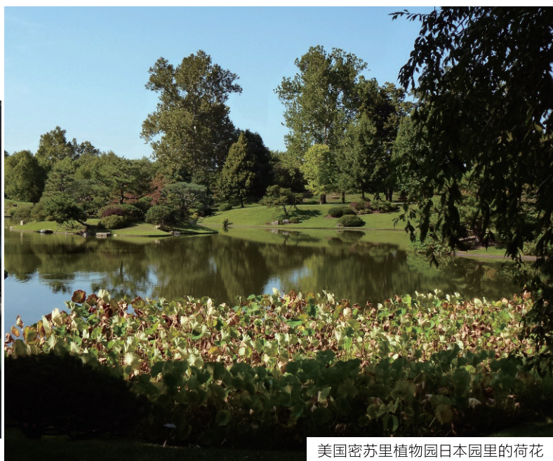
美国密苏里植物园日本园里的荷花