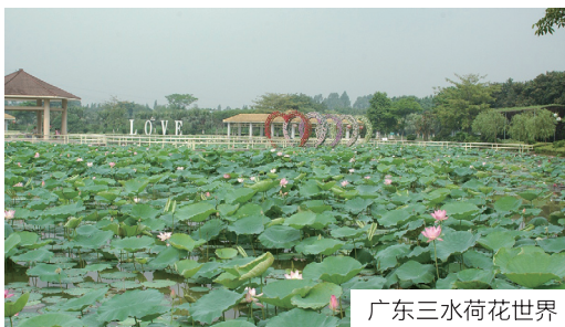
广东三水荷花世界

点,不仅仅在于种植范围最广、面积最大,从艺术的角度看,荷花具有点、线、面三要素的全部,其他花卉却缺乏‘面’”。听他这么一说,作为植物学工作者的我顿受启发,仔细一想,深有同感:荷花除具有很多点的特征(如花蕾、胚珠、柱头、莲蓬、莲子、叶柄上的短刺、藕尖)和线的特征(如叶柄、叶边缘、叶脉、花梗、雄蕊中的花丝花药、莲蓬边缘、莲鞭、莲藕、根、残荷等),还具有“小面”(叶片)和植株自然扩展、成片生长形成的“大面”特征,而这种壮观的大面特征正是