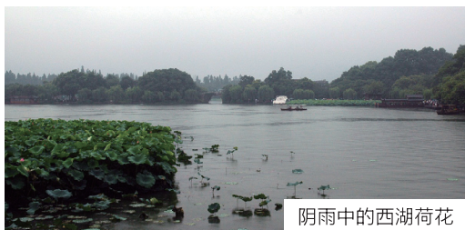
阴雨中的西湖荷花