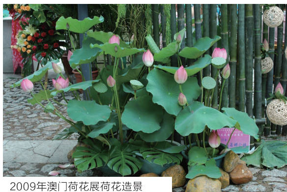
2009年澳门荷花展荷花造景