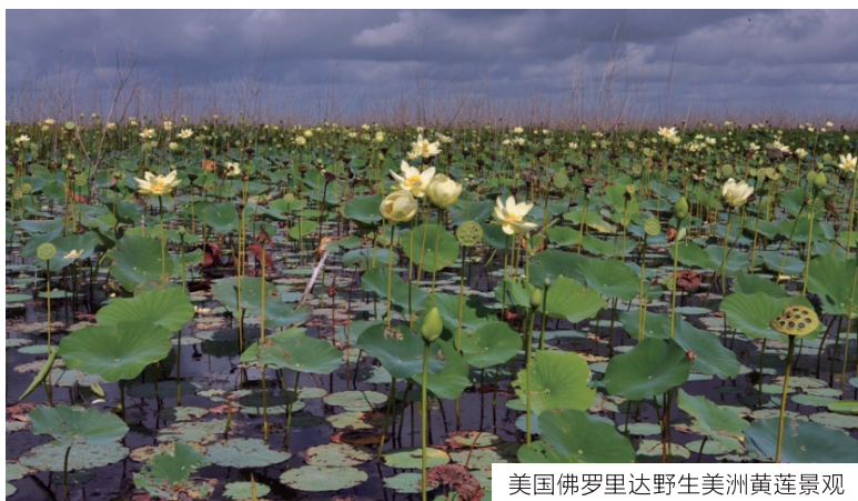
美国佛罗里达野生美洲黄莲景观