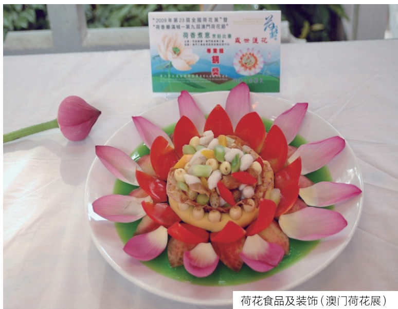
荷花食品及装饰(澳门荷花展)

除了池栽、湖栽营造景观外,荷花常作盆栽欣赏。但由于种种原因,美洲莲在盆栽中很少开花甚至不开花,因此盆栽的荷花基本上是亚洲莲或亚美杂交莲