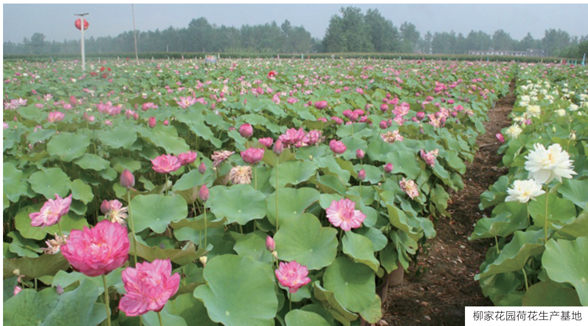
柳家花园荷花生产基地