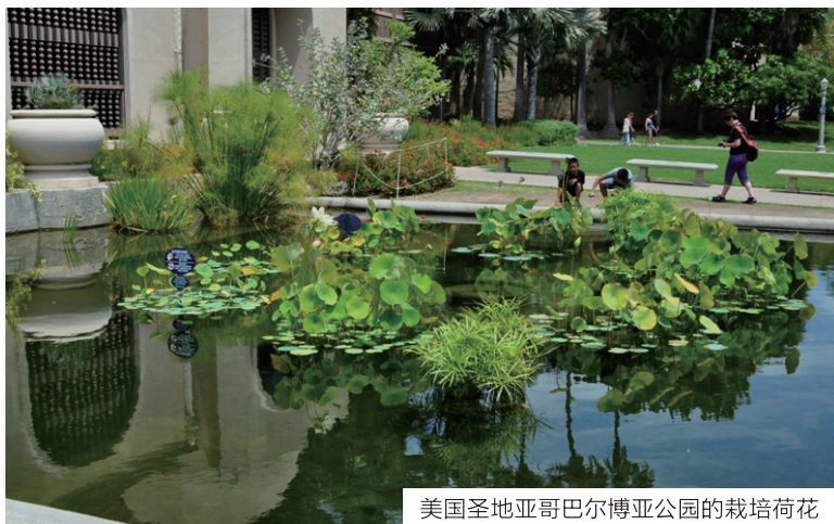
美国圣地亚哥巴尔博亚公园的栽培荷花

同美国较多的野生美洲黄莲自然景观相反,亚洲一些国家,特别是中国,利用荷花造景比比皆是,有时人工荷景的美丽甚至胜过自然景观。全国利用荷花营造的人工景观不胜枚举,历史悠久的赏荷佳地也不少,如杭州西湖、南京玄武湖、济南大明湖、武汉东湖等。全国各大公园、植物园和一些荷花相关研究单位、企业等也常常栽培有大量荷花,也是夏天赏荷的好去处,如中国科学院武汉植物园、华南植物园,上海辰山植物园,石家庄植物园,合肥植物园,厦门植物园,聊城植物园,武汉市蔬菜研究所,武汉中国荷花研究中心,江西广昌白莲研究局,宁波莲苑,重庆大