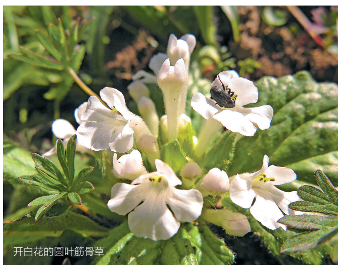
开白花的圆叶筋骨草