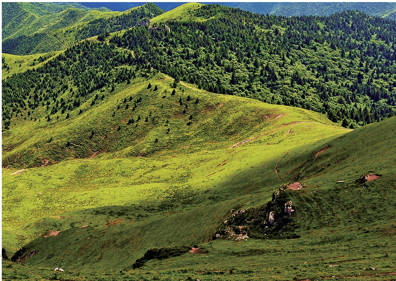
莲花山景观