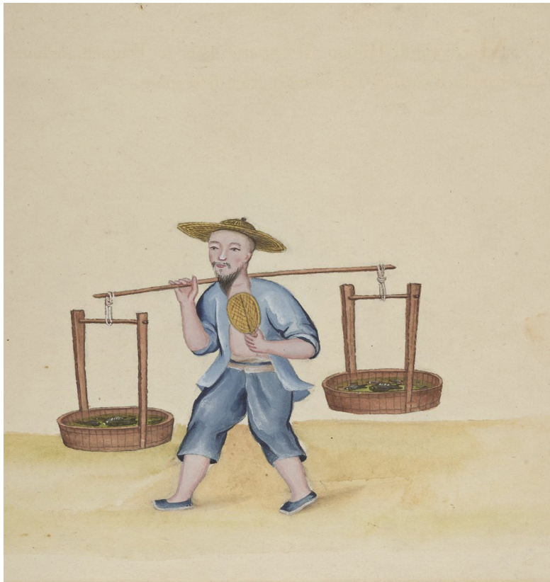
19世纪水粉彩画：卖鲜鱼，清朝京城市景风俗图

鱼的一面吃完了，吃另一面时不能叫翻，而是叫“调一戗”——寓意是渔船在海上不能沉了，不能翻了，此俗在连云港以外的渔区也广为流传。