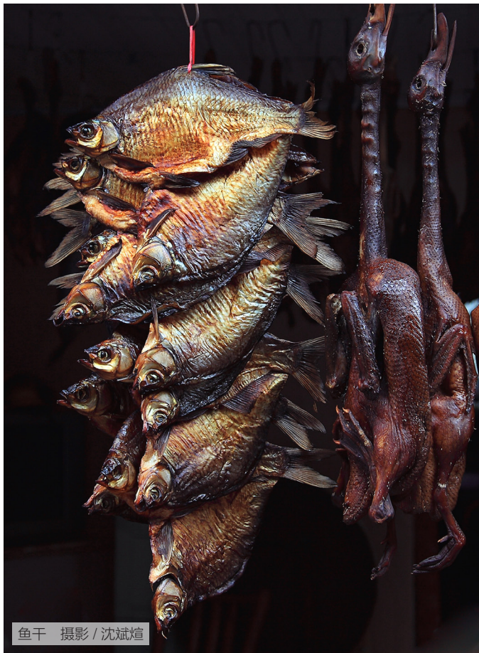
鱼干 摄影 / 沈斌煊