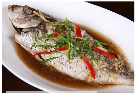
我国八大菜系，都离不开鱼菜名饌