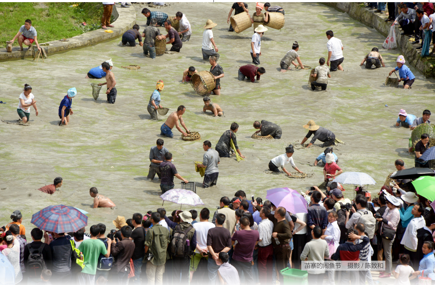
苗寨的闹鱼节