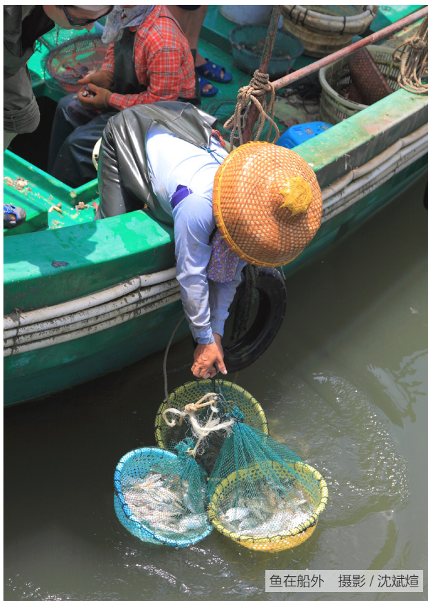
鱼在船外

中国有很长的海岸线，海上捕捞是海边渔村经济的主要内容。海上捕捞，季节性很强，大渔讯时海上渔舟穿梭，晚间灯火连片，十分繁忙。休汛期男子修船造渔船，妇女织补渔网。海上风险较大，渔民中盛行对