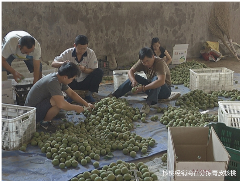
核桃经销商在分拣青皮核桃