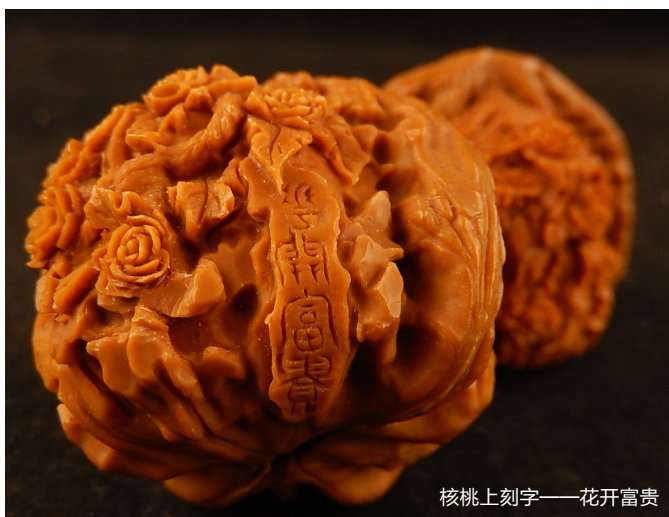
核桃上刻字——花开富贵

文玩核桃是原产中国的特异种质资源，野生于北方山区核桃楸与核桃的混生林木之中。植物分类学将其命名为河北核桃、麻核桃、山核桃。麻核桃坚果以其表面凹凸不平，通体布满沟纹穴点而得名。因其外形纹络多样、脊谷错落、尖座奇异而备受文人雅士的热捧和青睐，成为古今把玩欣赏的佳品，被誉为“文玩核桃”。文玩核桃风靡国内各大中城市，种植区扩展到北京、天津、河北、东北、西北部分地区。而且由于野生麻核桃数量稀缺，自然就成了人们猎求和收藏的对象，一对核