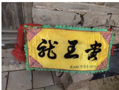
图 5 龙王堂匾额

状修建,而圣寿寺象征着龙头,寺中两口古井象征着龙眼。庙宇联结着村民与水资源符号——龙神、古井的微妙关系,通过圣寿寺的民俗象征,形成了村落深层次的文化认同。如今圣寿寺虽仅剩断壁残垣,然寺中仍是香火不断,逢年过节,龙田村民仍会去圣寿寺求神拜佛,祈求吉祥。“在村拆迁后,家人会在除夕 12 点一起到庙(圣寿寺)中祈福。” ⑩ 龙田村圣寿寺祈福已成为一种集体无意识的“信仰惯习” [28] 。龙田村于 2013 年开始整村拆迁,2015 年在圣寿寺的旧址上新建一间砖房,碑上刻着“意恢复原庙” ⑪ 。虽仅存断壁残垣,但寺内的古树仍然茂盛,古井至今仍存。除了砖房圣寿寺外,还有两座简易小神龛,都供奉着观音与如来佛。新时期原有共同用水和祈雨关系弱化,“龙王结亲”传说和祈雨仪式所勾连的村落共同体,通过凸显“龙王传说结神亲”语境,恢复传统民俗关系,构建出一个区域社会新的村际文化关联。