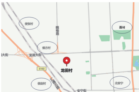
图 2 龙田村相邻村落

相邻村落是指在龙王传说中出现救助龙王的龙田村邻近村落: 安宁、使赵、侯坊、张村、聂村等村,如图 2 所示 ② 。