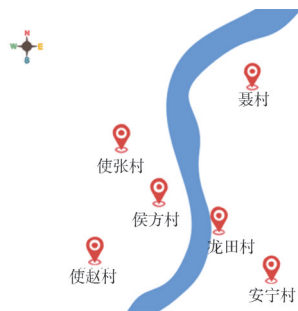
图4 白龙河流经村落示意图

围绕水资源,龙田村民众“发明”了一系列传说来表达对白龙河用水的合法性。根据史料与口述资料绘制出白龙河流经图,如图4所示。图上使赵等村落紧邻白龙河,得以利用白龙河水进行日常生活和农业生产。传说白龙河是龙田村的女婿四龙王开凿,这些村庄便形成一个龙田村优先,其他村落次之的白龙河灌溉秩序。