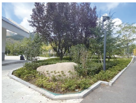
图2 上臧山公园节点植物配置

分最低的为上臧山公园,其他公园植物种类应用较为丰富,原因为上臧山公园面积相对较小,植物应用数量有限,公园种植了80余种乔灌木及地被植物,植物搭配层次丰富(图2),但部分区域种植密度较大,影响低层植被的生长,局部区域使用红叶石楠绿篱,冬季需采用防风保暖措施(图3),增加了隐性碳足迹 [16] 。植物的选择应注重乡土植物、粗放型植物的应用、乔灌木的搭配。在已有的研究中发现,对比其整株固碳均量来看:乔木类>灌木类、落叶植物>常绿植物 [17] 。绿灰色占比得分为3.40~4.18,其中岷山公园得分较低,铺装及建筑面积占比约23.9%,限制了碳汇功能的发挥,但7个公园均临近居民区,调查中发现虽然铺装满意度较低,但使用者对于充足的活动空间需求很大,如丹山公园、金岭山公园在公共活动空间中通过树池坐凳、林下健身广场的方式,在满足使用者健身、活动需求的基础上,一定程度上保证了碳汇的功能需求。