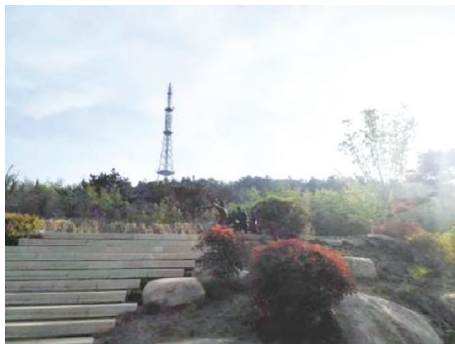
图5 丹山公园活动空间

3) 绿色交通满意度分析。绿色交通的表现相对较好,得分为3.21~3.93,特别是绿道环境质量得分较高,其中团岛山公园绿道环境质量的评分达4.43,显示出公园绿道两侧植物配置效果较好,整体环境质量较高,主要原因为近年来慢跑、骑行等活动的人数增多,公园设计开始注重绿道及两侧环境的设计。公共交通的可达性得分也较高,为3.05~3.95,说明公园与周边公共交通系统的连接性较好,市民前往公园的便捷性较高,如上臧山公园紧邻居住区,被称为小区“后花园”。慢行系统路网的评分为3.42~3.92,各山地公园慢行系统较为完善,但由于地形因素,部分路网无法实现无障碍通达,需要进一步完善和细化步行路径的设计。