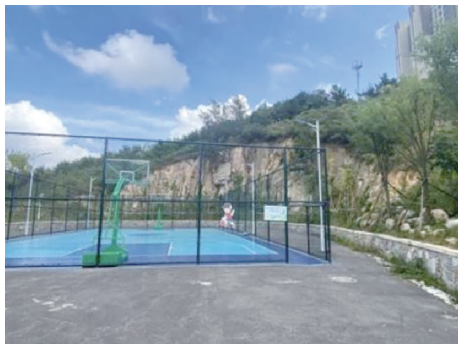
图4 上臧山公园断崖式山体

味活动空间,既保护了现有地形又实现了因地制宜(图5)。低碳材料得分较好,为3.02~3.92,在海绵城市理念影响下,透水材料应用较多,7个公园低碳材料主要为透水混凝土,少量区域利用废弃材料。低碳宣传得分为2.03~2.96,从公园整体的宣传设施来看,关于低碳的宣传较少,表明公园在传播低碳理念、增强公众意识方面的投入不足,后期需进一步加强环保宣传。