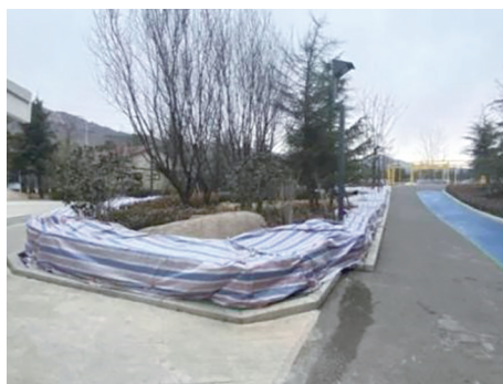
图3 上臧山公园植物越冬措施

2) 低碳路径满意度分析。7个公园低碳路径的评分为2.68~3.91,表明公园的低碳路径指标一般,需进一步优化。其中,绿色建筑得分最低,为2.41~2.64,反映出公园在绿色建筑上的不足,除建筑设计本身外,还可以通过建筑与周边环境巧妙融合的方式,减少碳耗;此外大部分山地公园路灯、指示牌等基础设施均采用风能、太阳能等形式,一定程度上降低了碳耗。山体修复得分为2.78~4.19,除上臧山公园、金岭山公园部分区域外,其余公园山体现状条件较好,上臧山公园存在断崖式山体裸露现象(图4),因坡度太陡,美化效果欠佳。各公园对于坡度较缓的山体空间处理较好,如丹山公园利用高差形成不同的趣