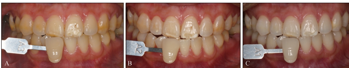
A: 术前比色A3; B: 一次诊室漂白(38% HP),术后即刻比色为A2,着色斑块无法去除; C: 家庭漂白(10% CP)1月后,牙色显著改善,着色斑块颜色变淡。

隔至少1周。四环素牙、釉质矿化不全斑块等着色位置深的情况不适宜单独采用诊室漂白,选择家庭漂白或在一次诊室漂白后配合家庭漂白能使漂白治疗获得更为确切的效果(图5)。除此之外,漂白后釉质表面会有轻微脱矿和粗糙度增加 [3] ,需指导患者术后1周避免食用含色素食物。长期稳定性需要靠患者保持良好的口腔卫生习惯来维持,每半年进行牙面抛光,术后1~3年可再次漂白进行颜色维护。