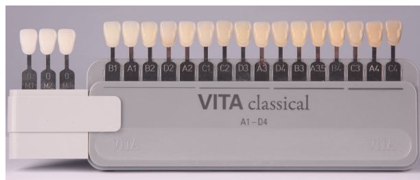
图 3 将Vita Classical比色板按明度排列(左侧为漂白色)

1.2.2 牙齿颜色的评估方法 漂白治疗中评估和记录牙齿颜色必不可少, 牙齿颜色评估方法包括视觉比色、数字化图像评估和色度仪测量等。视觉比色临床实施简单。在自然光线下肉眼观察成品比色板, 选择与目标牙颜色相似或相近的比色片确定牙齿颜色, 可将比色板放在牙齿旁边使用数码相机记录。将Vita Classical比色板按明度排列(图3), 每个比色片对应1个色阶等级(表1), 通过计算色阶变化量(术后色阶与术前色阶等级分值的差值) \Delta SGU (shade guide units) 客观评估漂白效果, \Delta SGU \geq 2 视为有效。漂白治疗常常获得超过B1的颜色, 目前比色板已经增加了漂白色, 即OM1、OM2和OM3(图3)。数字化图像是重要的临床资料记录, 同时能帮助医师向患者直观展示漂白治疗的效果。色度仪测量是客观指标, 在临床研究中常用。