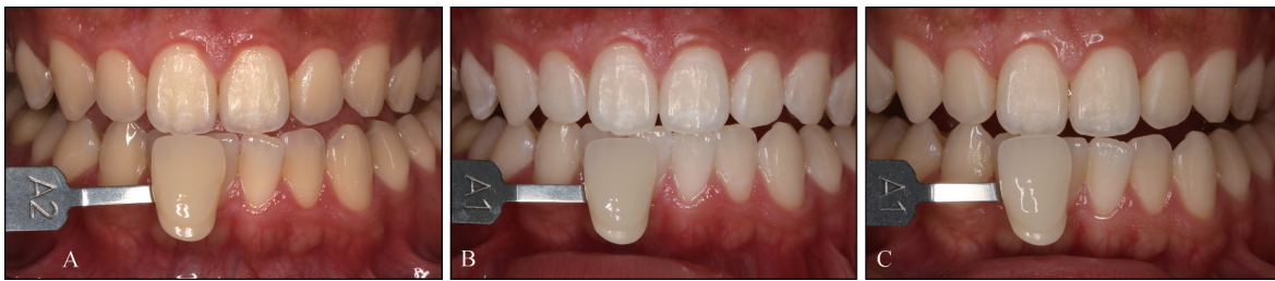
A: 术前比色A2; B: 一次诊室漂白(38% HP),术后即刻颜色提升,比色较A1浅; C: 术后1周颜色回弹,比色A1,但较术前有改善。

访时颜色出现明显回弹(图4)。临床研究 [27-28] 发现:单次诊室漂白治疗结束即刻牙齿颜色就开始回弹,1周后回弹速度减缓,约6周颜色稳定,较基线颜色有明显改善。家庭漂白后牙齿颜色回弹规律类似,但回弹的程度更低 [10] 。长期的颜色回弹通常在术后6个月开始,但是在首次漂白方案合理的前提下,漂白效果大约维持2年 [29-30] 。长期回弹程度与牙齿基线水平、着色原因及患者饮食习惯等因素相关。