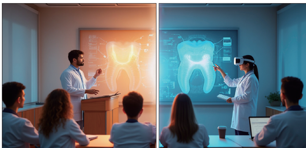
此图由夸克AI工具生成。

真实的临床体验 [25] 。智能虚拟患者系统能使学生在实践中具象化地理解理论知识, 形成实践深化理论理解的正向循环 [26] 。人工智能辅助口腔教学开启了口腔医学“数智化”教学的新时代, 口腔教学质量也因此飞速提升。未来, 随着人工智能技术的不断发展, 必将涌现出更多新兴的教学模式与理念。然而, 机遇往往伴随挑战。人工智能辅助口腔教学的模式在提高教学质量的同时, 也给口腔教师带来诸多新的挑战。