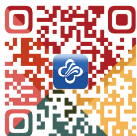
扫描二维码 1 可见国内外报道的 SIT 人群分别作为肝移植受者和供者的案例

在过去, 由于肝脏在解剖上的不完全对称性, 尤其是 SIT 人群的血管和肝脏位置的复杂性, 肝移植对于 SIT 患者来说是绝对的禁忌证 [14] 。SIT 导致独特的血管解剖, 需要准确定位移植物, 对医师来说是不小的挑战。不仅需要术前对患者肝脏进行必要的影像学检查, 充分了解及评估患者肝脏的情况, 还对术者的操作习惯等是一项考验 [15-16] 。因此, 局限于 SIT 的发病率及手术难度, 即便是作为治疗终末期肝病最有效的治疗手段, 世界范围内报道的此类病例数仍然较少。笔者总结了国内外 SIT 肝移植相关报道, 国外报道的 SIT 人群分别作为肝移植受者和供者的案例见附表 1 和附表 2, 国内报道的 SIT 人群分别作为肝移植受者和供者的案例见附表 3 和附表 4 ( 扫描二维码 1 可见 )。