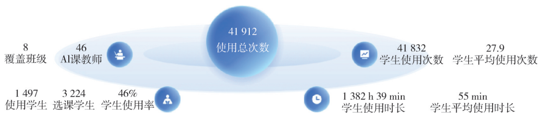
图1 首医《医学英语术语》课程AI学伴使用概览