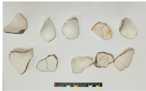
图1 虎乳灵芝药材性状

性状鉴别结果显示如图1所示,本品为不规则片状,大小不一,直径为1~8 cm,厚为1~3 cm。切面不平整,白色或淡黄色,呈颗粒性。外皮呈灰褐色薄且多粗糙有不规则裂纹。质地坚硬,气微,味淡。