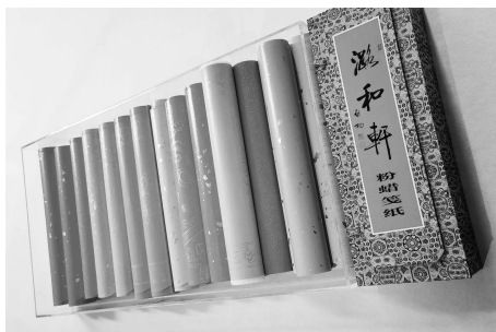
图1 “潞和轩”粉蜡笺纸实物

根据使用颜料的不同,从颜色上进行分类,有蓝、白、粉红、淡绿、黄五种色系,即“五色粉蜡笺”。经过颜色调配,还可制作出色彩斑斓的彩色粉蜡笺,如笺色妃、笺玫瑰、笺鹅黄、笺青古等,如图1所示。通过在色彩上继续创新,还可以制造出更多色彩斑斓、更多元化的粉蜡笺纸。