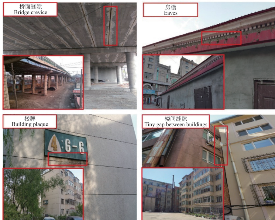
图1 东方蝙蝠的4种栖息地类型