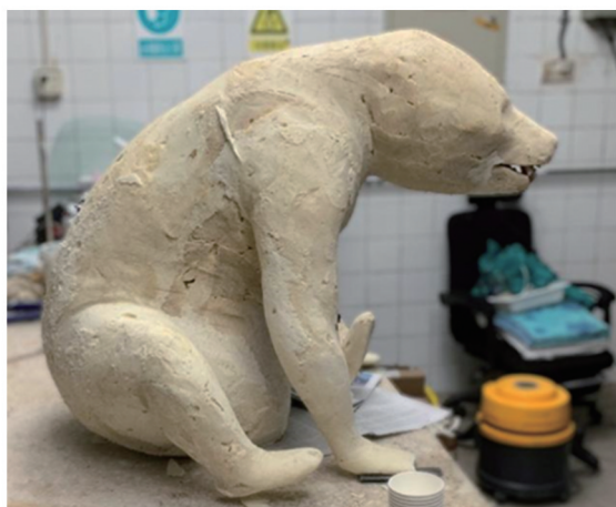
图6 大熊猫标本假体模型侧面

头身结合： 将制作完成的头部模型与身体模型进行结合，使用聚氨酯发泡剂填充结合处及形态不饱满的区域（图6）。