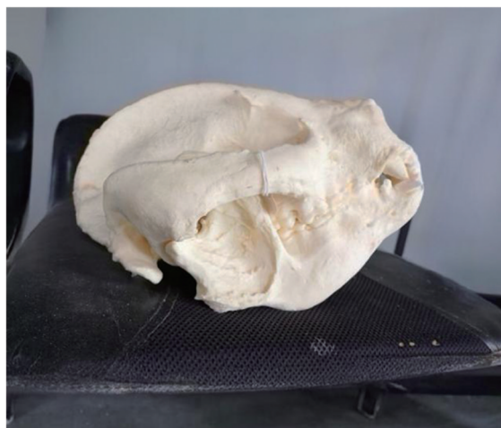
图4 大熊猫标本的头骨

Figure 4 The skull of a giant panda specimen