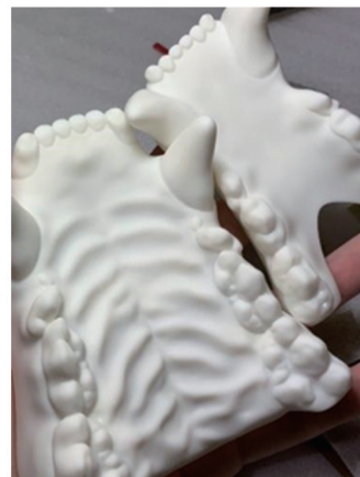
图5 3D打印的大熊猫标本口腔模型

由于常规商品动物口腔模型对大熊猫剥制标本不适用,本次采用3D扫描打印技术辅助制作。首先,使用3D扫描仪对大熊猫头骨模型进行数字化采集,随后通过三维设计软件对口腔结构进行单独分割与形态优化。然后,使用适配光敏树脂的3D打印机,对优化后的数字化口腔模型进行实体打印(图5)。接着,将打印好的口腔模型与原头骨进行比对并精细修整。最后,参照活体口腔的真实颜色进行上色处理,完成头部模型的全部制作。