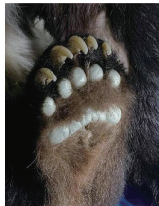
图8 大熊猫标本的脚掌整形

在处理脚掌表皮破损部位时,需先将翘起的皮肤边缘打磨平整,再使用AB塑钢泥填补缺损区域并塑形,最终参照健康脚掌肉垫的自然形态与纹理等进行雕刻和着色(图8)。至此,标本制作完成(图9)。