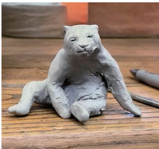
图3 大熊猫的泥塑小样

姿态设计是动物剥制标本制作过程中的重要环节,所设计的体态需同时体现科学性(符合动物生活习性)和艺术性。通常,姿态越生动、动势越强,假体的制作难度越高。本次为大熊猫标本设计的姿态为从坐姿正欲起身的动势。为真实体现标本动势,制作人员通过反复观察园内活体大熊猫行为举止,并参照大熊猫日常生活照片及视频,使用雕塑泥按照1:15的缩小比例制作了泥塑小样(图3),作为后续假体制作的形态依据。