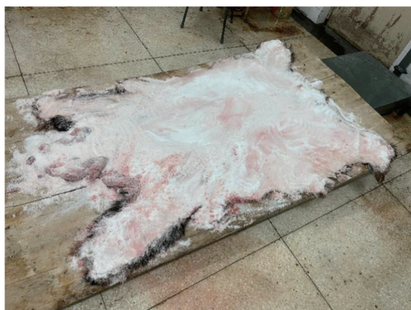
图2 皮张的脱水处理

完成上述清理后,开始进行皮张脱水。将皮张内侧打开向上,平铺至最大面积,然后均匀涂抹氯化钠覆盖内侧,厚度需达2~3 cm,并确保所有部位(尤其是耳廓内侧及口腔边缘)均被充分覆盖(图2)。脱水过程持续2 d,每日需更换氯化钠以保证脱水效果。此步骤的目的是去除皮张内残留的水分和组织液,减缓微生物降解,发挥初步防腐作用。