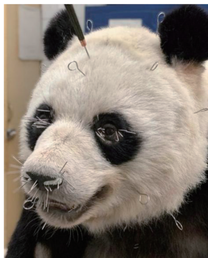
图7 大熊猫标本的面部整形效果

面部皮张整形是决定标本神态与生动性的关键。整形时需格外注重眼、鼻等薄弱部位的处理，这些部位皮肤较薄，宜选用更细小的针具进行皮张边缘的固定与塑形（图7）。待眼部皮张位置稳固后，使用AB塑钢泥塑造眼角等细节，并用丙烯颜料着色，可适量使用模型光油剂增加瞳孔部位的反光度，以达到真实生动的效果。