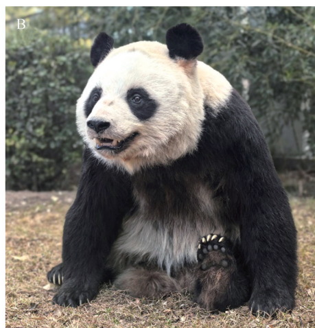
图9 大熊猫生活时期照(A)和剥制标本照(B)

Figure 9 Photos of the giant panda during life period (A) and the taxidermy (B)