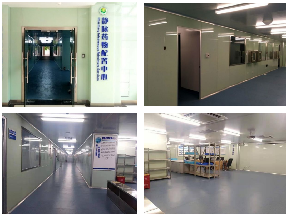
Fig. 1 Pharmacy intravenous admixture service simulation center

静脉药物配置技术课程最重要之处在于培养学生熟练掌握配置静脉药物。由于实验学时较多，与实验室管理紧密关联，为使学生在有序、安全、高效的环境中学习，必须确保资源优化、安全管理和环境可持续性这一实验室管理的核心原则。我校于 2018 年建成校内模拟静脉药物配置中心（简称：模拟 PIVAS）（图 1），直接支持静脉药物配置实验的顺利进行。通过良好的设备维护、药品储存和应急响应计划，实验室管理能够促进学生的实验技能的提高与实验安全的进行 [5] 。在可持续发展的理念下，实验室管理关注资源的合理利用和环境友好实验，为学生培养全面素养提供了实际平台。因此，实验室管理与静脉药物配置技术课程的紧密关联不仅为课程提供了良好基础，也培养了学生对实验室管理的认知和实验经验。