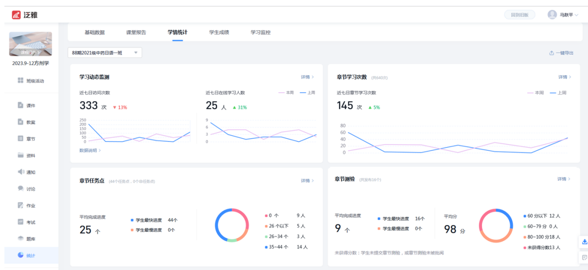
Fig. 3 Related evaluation content of course online evaluation system (Chaoxing)

力,从而激发学习积极性、能动性,增加信心,奠定学习能力的基础。在线学业评价体系经过三轮实践完善,在考试难度基本持平的情况下,学生的平均成绩在 2020 年较 2019 年未采用在线学业评价体系时提升 2%,并且 2020~2023 年平均成绩逐年提高,基础知识掌握程度、综合分析解决问题能力也均有所提升(见图 4)。学生参加以中药学、方剂学知识考核为主的“辽宁省高等院校中医药知识与实战技能大赛”成绩优异,连续三年获得团队金奖。