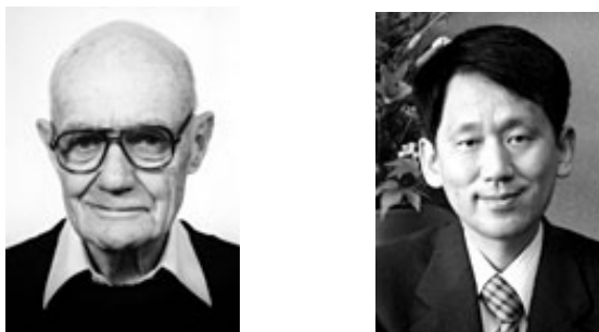
图2 诺贝尔化学奖得主——约翰·芬恩（左）和田中耕一（右）